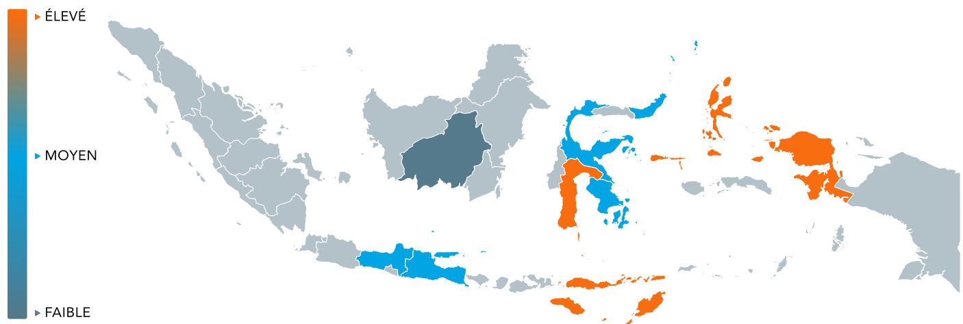
Figure 1 : Manifestations contre l'exploitation minière dans les provinces indonésiennes (1968-2019)